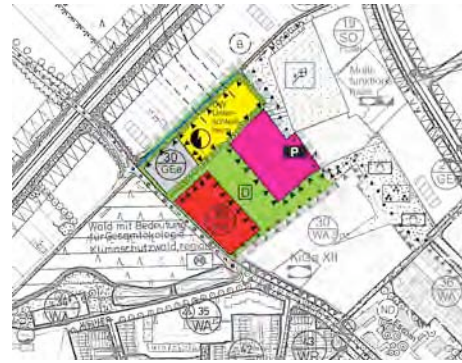
25. Änderung Teil II des Flächennutzungsplanes Unterschleißheim, 20.07.2009