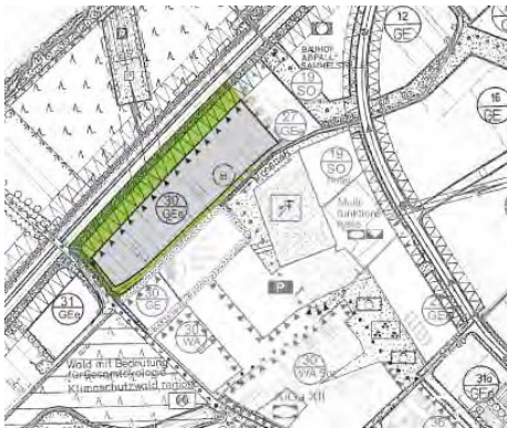
25. Änderung Teil III des Flächennutzungsplanes Unterschleißheim, 15.09.2008