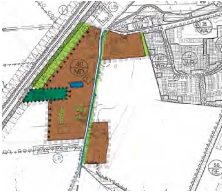
25. Änderung Teil I des Flächennutzungsplanes Unterschleißheim, 20.07.2009