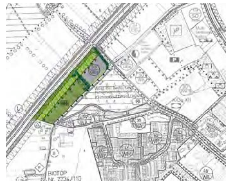
25. Änderung Teil IV des Flächennutzungsplanes Unterschleißheim, 27.08.2009