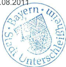
Rolf Zeitler Erster Bürgermeister