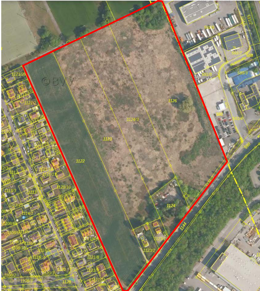
Abb. 1: Untersuchungsgebiet (rot) an der Kreuzstraße, Unterschleißheim