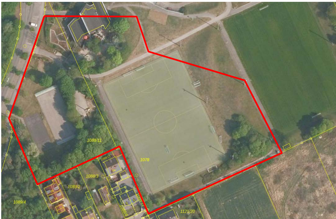
Abb. 2: Erweiterter Umgriff im Norden

Da sich der Umgriff in der Bearbeitungsphase nach Norden hin erweitert hat, fand dort keine faunistische Erfassung statt. Ergänzend wurde jedoch das Lebensraumpotential im März 2022 erfasst, um die Notwendigkeit von Nachuntersuchungen zu evaluieren. Bei der Nachuntersuchung konnten keine relevanten Lebensraumstrukturen identifiziert werden. Damit kann eine Betroffenheit von Arten des Anhangs IV der FFH-Richtlinie und der europäischen Vogelarten gemäß Art. 1 der Vogelschutzrichtlinie, bei Berücksichtigung der formulierten Vermeidungs- und Minimierungsmaßnahmen, und damit die Erfüllung von artenschutzrechtlichen Verbotstatbestände nach § 44 Abs. 1 i.V.m. Abs. 5 BNatSchG ausgeschlossen werden. Bei den vorhandenen Strukturen handelt es sich nicht um essentielle oder unersetzbare Habitate.